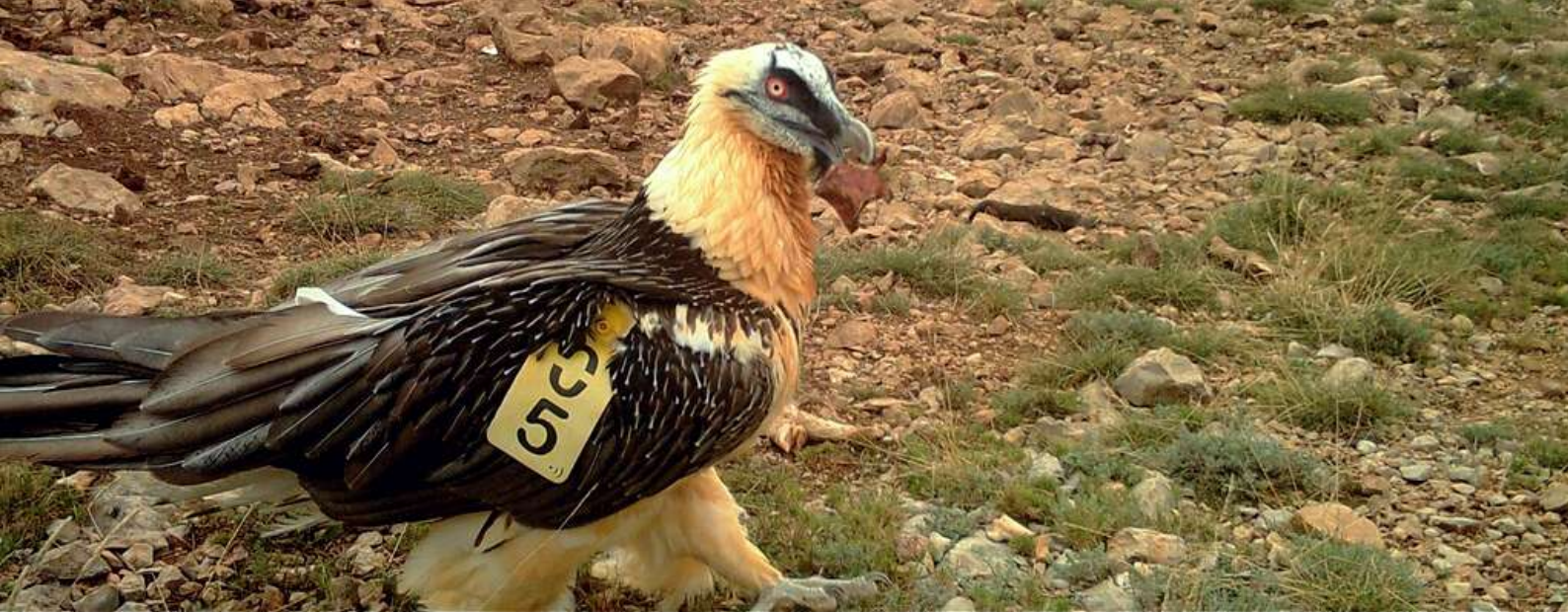
Formiga de visita

3. Període d'independència: les pioneres a l'hora de saltar del niu i alçar el vol van ser les femelles, primer Dalila i uns dies després Dena, l'exemple de les quals a la fi va seguir Durall el 9 de juliol. Els més audaçs vols fins al moment els ha realitzat Dena, aventurant-se des de Penyagolosa al sud fins més enllà de l'Ebre al nord. A més, en aquest període les nostres amigues van començar a fer honor al seu nom deixant caure ossos des de l'altura per a alimentar-se amb major facilitat.