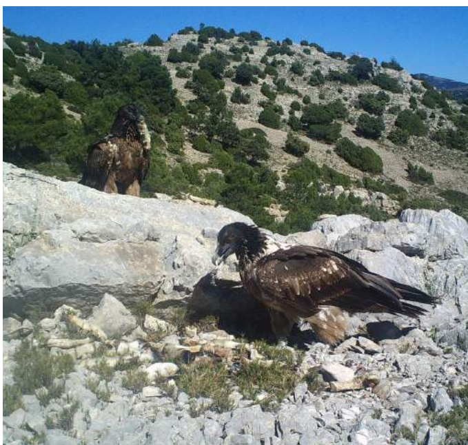
Amic i Alòs al menjador del 'hacking'