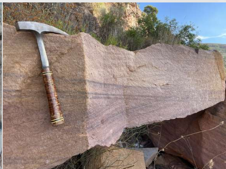
Laminaciones cruzadas en las areniscas