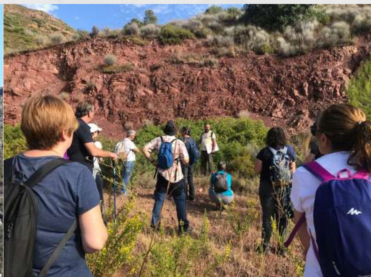
Cantera de argilitas cercana al Pi del Salt

Para poner de relevancia este patrimonio geológico se ha diseñado una GEO-RUTA que se inicia y se acaba en el aparcamiento de la Font de l'Oró (Náquera), con un recorrido casi circular (con cortos ramales de ida y vuelta) de 6,3 km. La primera visita a la nueva ruta la realizamos el pasado 8 de octubre.