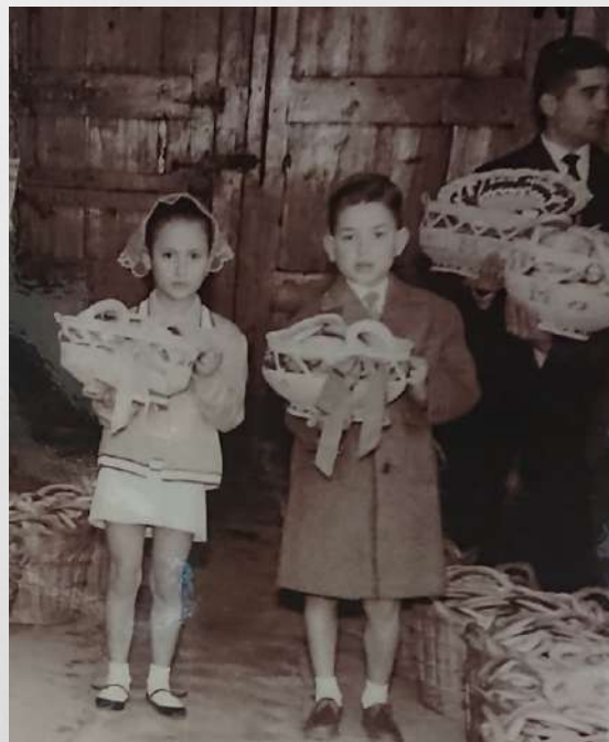
Ferrán de niño (hacia 1950): "Els rotllos a la festa de Sant Antoni d'Olocau". Fotografía que forma parte de la exposición permanente del Centro de Interpretación del Parque Natural de la Sierra Calderona (Náquera).