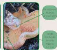
El rebollón tiene un sabor dulce y agradable.