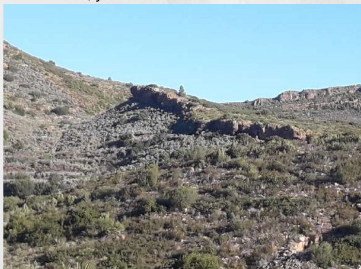
"La Cagada", formación cuaternaria sobre argilitas del Triásico en un claro contacto discordante

La Geología es la ciencia que nos puede permitir entender por qué está aquí la Sierra Calderona, como y cuando se originó, de qué tipo son las rocas que la forman, que había antes de formarse la sierra, como se ha llegado al paisaje actual y, en definitiva, entender los procesos naturales, conocer a través de la Sierra Calderona un apasionante capítulo local de la historia de La Tierra, saber por qué hay aguas subterráneas, y descubrir muchas más cosas del terreno sobre el cual andamos.