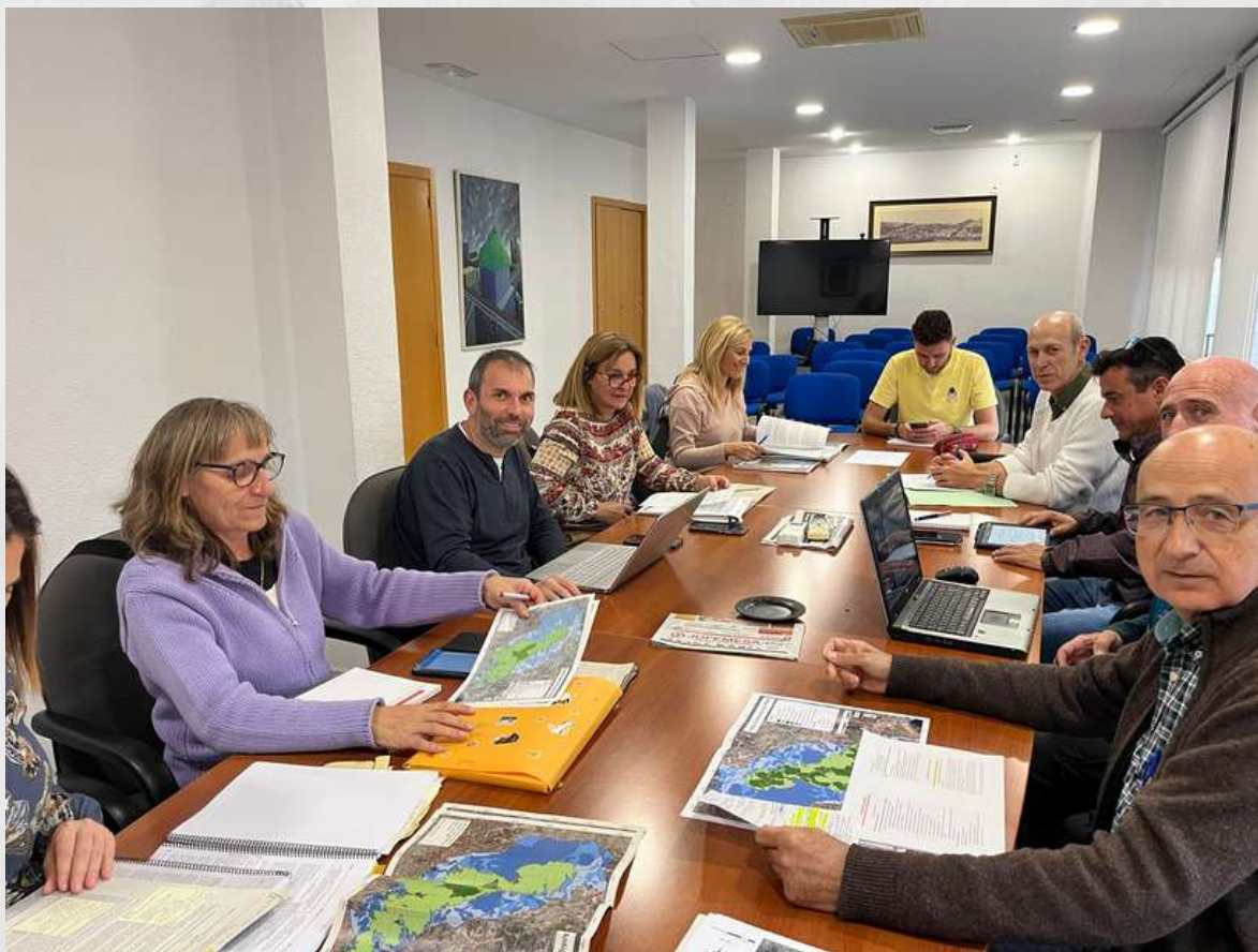
Los miembros de la Comisión Normativa en la última reunión celebrada en Gilet

El artículo 80.12 del PRUG (Plan Rector de Uso y Gestión) de la Sierra Calderona establece que el Presidente de la Junta Rectora podrá convocar las comisiones que fuera necesarias, dando cuentas al Pleno de la Junta de las actividades encomendadas. Por estos motivos, en 2016, se procede a la puesta en marcha de dos Comisiones de trabajo (Grupo de Prevención de Incendios y Grupo de Uso público-Turismo) y en 2021 a la Comisión Normativa.