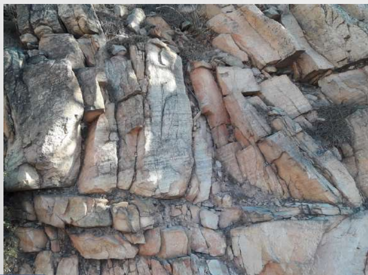
Fracturas por distensión en las areniscas Triásicas

Para poner de relevancia este patrimonio geológico se ha diseñado una GEO-RUTA que se inicia y se acaba en el aparcamiento de la Font de l'Oró (Náquera), con un recorrido casi circular (con cortos ramales de ida y vuelta) de 6,3 km. La primera visita a la nueva ruta la realizamos el pasado 8 de octubre.