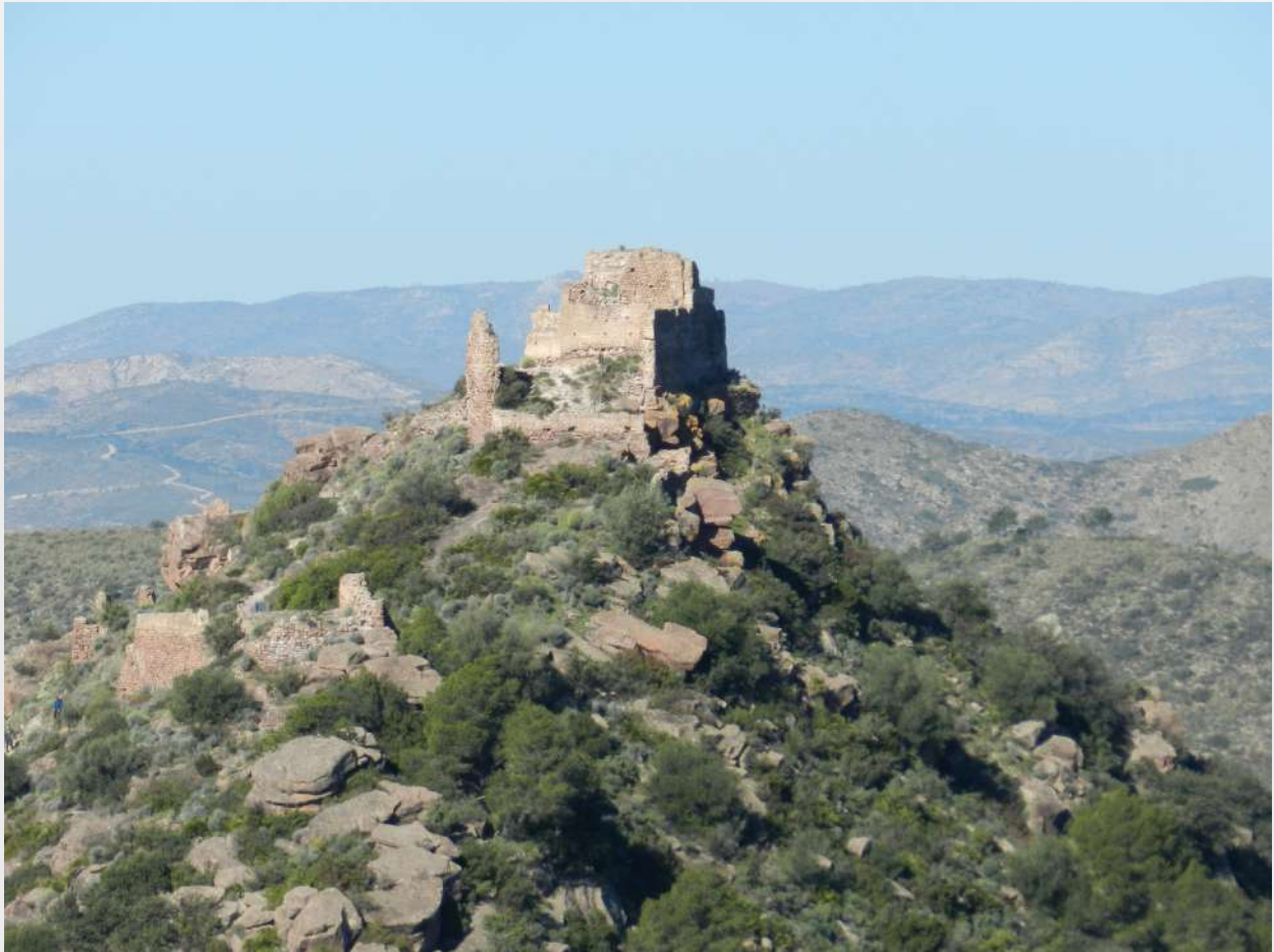
Castell del Reial (Marines - Gátova)