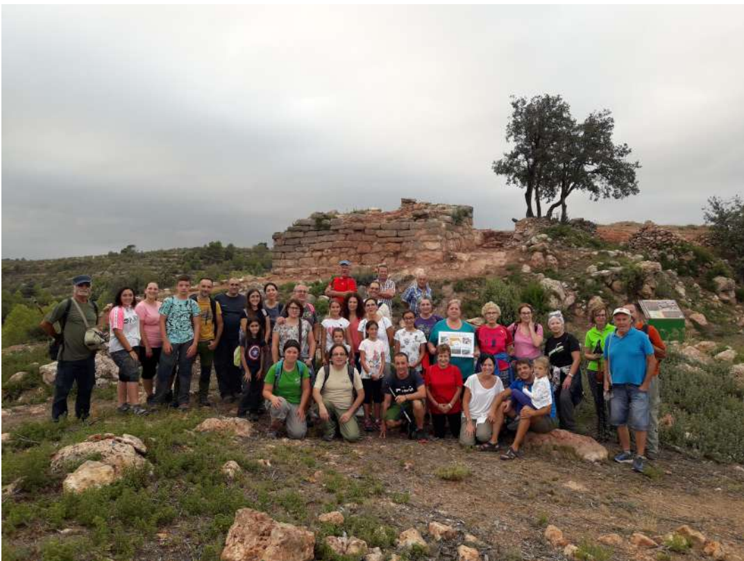
Qué veien els ibers a la nit. Visita al poblat iber "El Torrejón" i observació d'estreles. Gátova, 25 d'agost. Que veían los íberos por la noche. Visita al pobaldo íbero "El Torrejón" y observación de estrellas. Gátova, 25 de agosto.