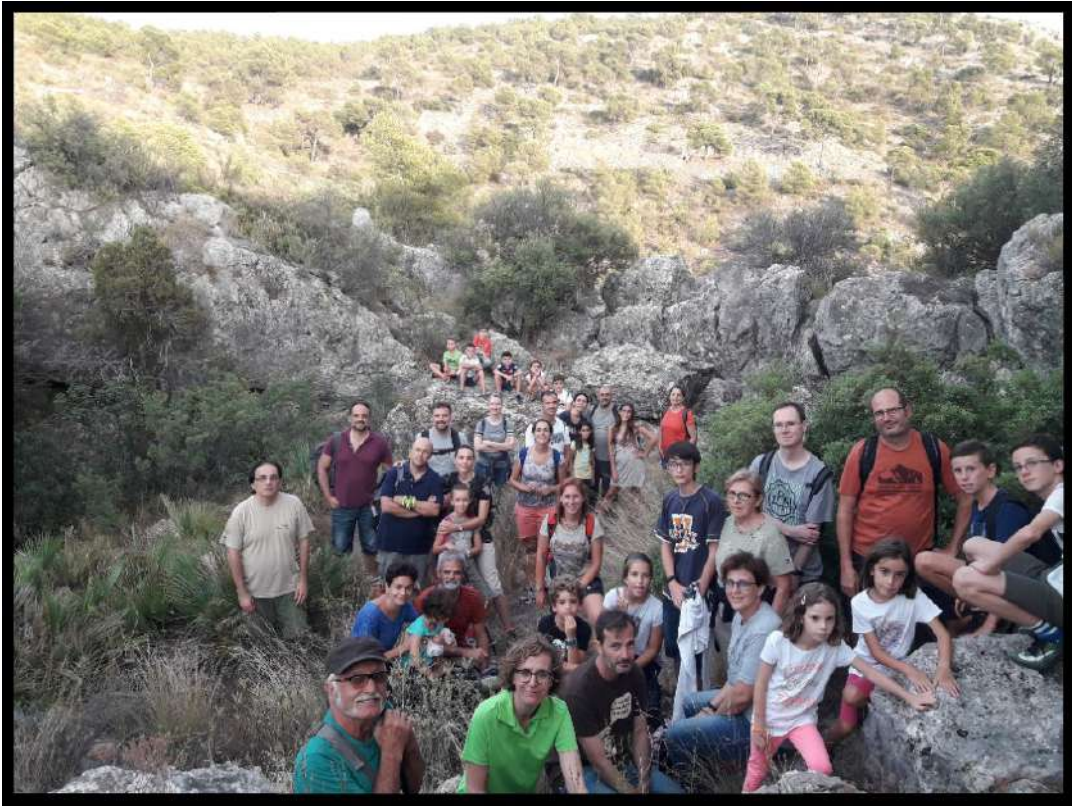
Nit de Rates Penades, els nostres desconeguts aliats nocturns. Serra, 10 d'agost. Noche de Murciélagos, nuestros desconocidos aliados nocturnos. Serra, 10 de agosto.