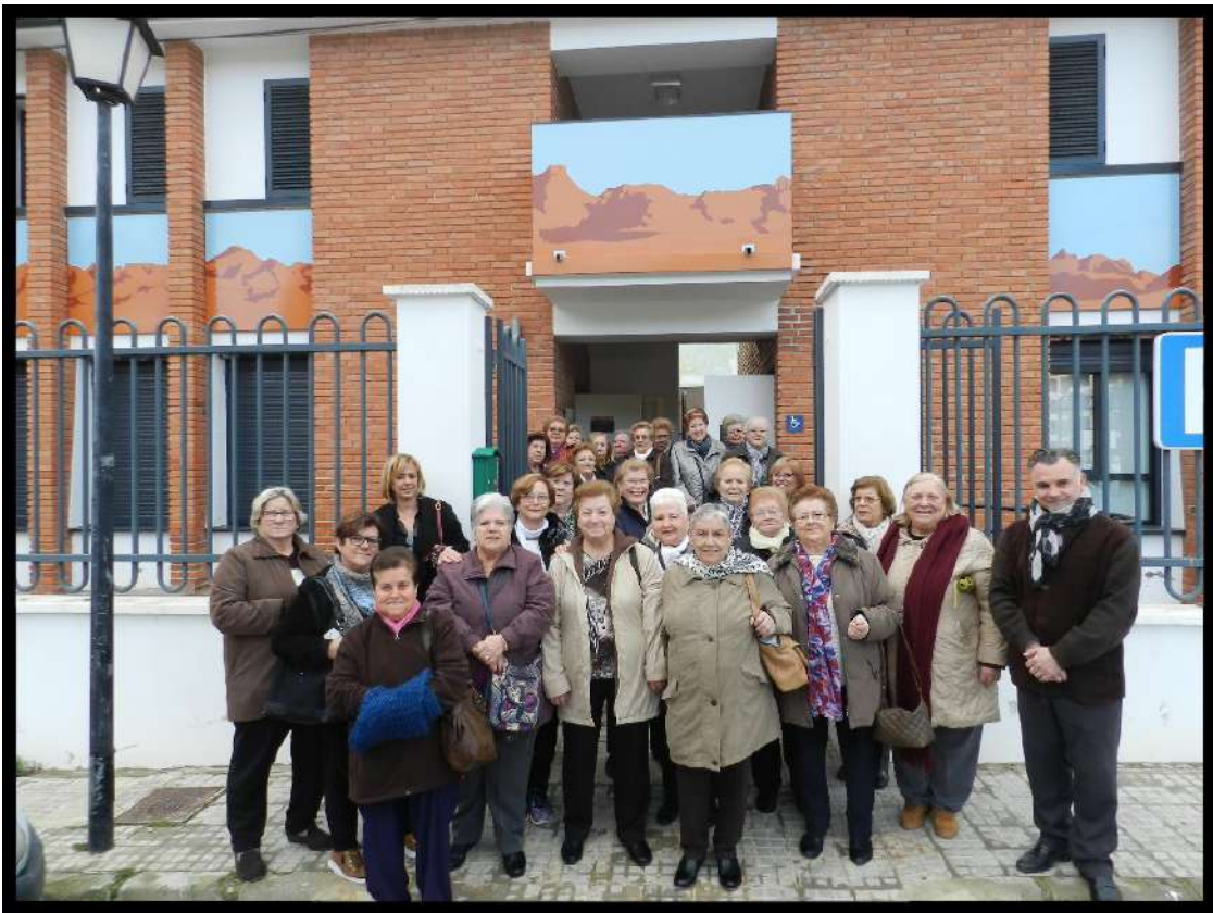
Dia de la Dona, Nàquera (València), 5 març 2018 Día de la Mujer, Nàquera (València), 5 de marzo 2018