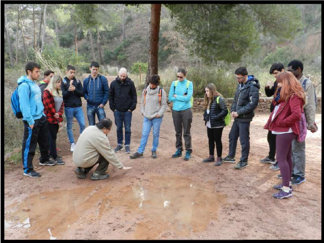
Visita IES Saler (València), Tècnic Superior en Educació i Control Ambiental Visita IES Saler (València), Técnico Superior en Educación y Control Ambiental