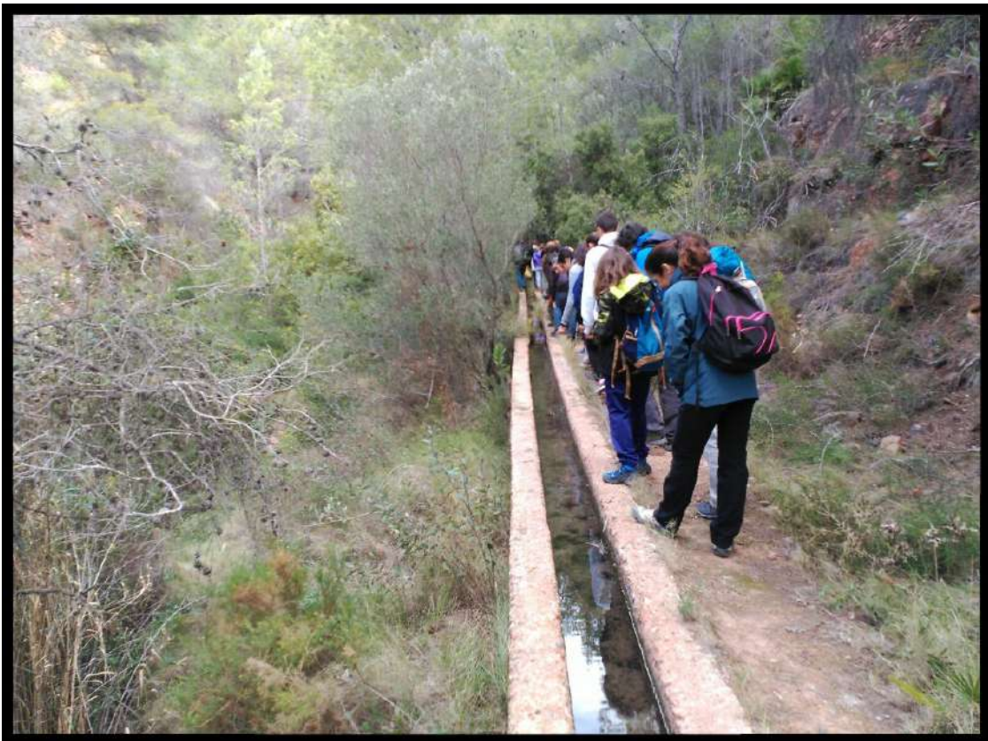
Dia Mundial de l'Aigua. Marines Vell. 25 de març 2018 Día Mundial del Agua. Marines Vell. 25 de marzo 2018

Per a consultar números anteriors del Butlletí punxa ací Para consultar números anteriores del Boletín pincha aquí