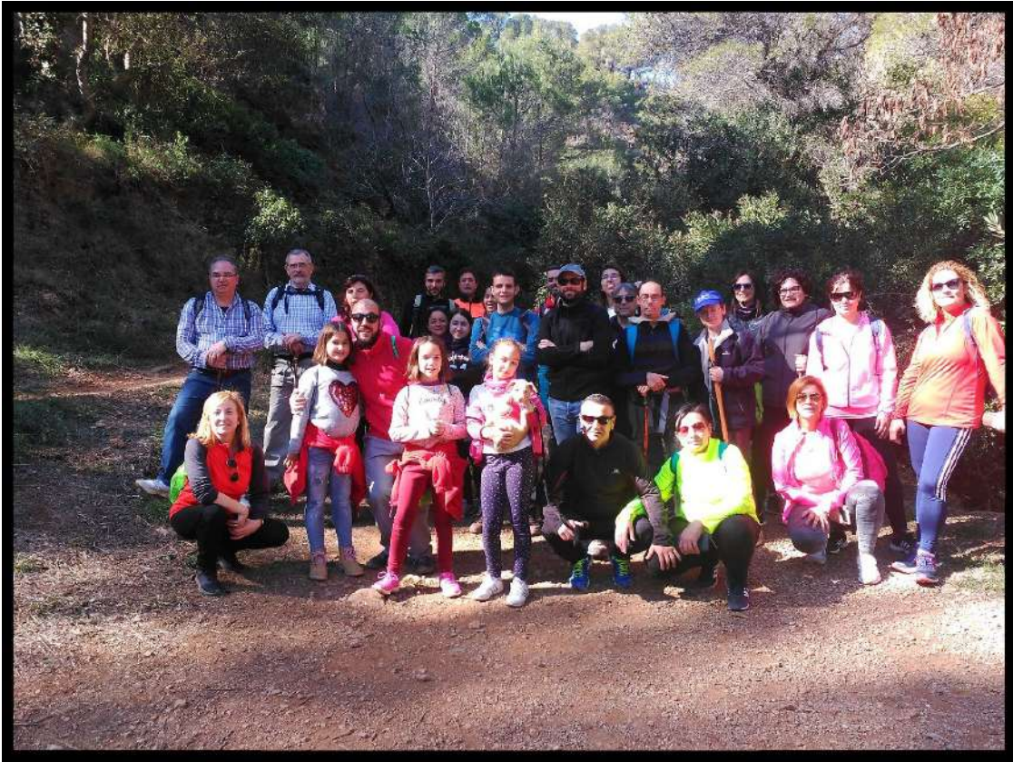
V Marcha Solidaria contra el Càncer. Serra (Valencia), 25 febrero 2018 V Marxa Solidària contra el Càncer. Serra (València), 25 febrer 2018