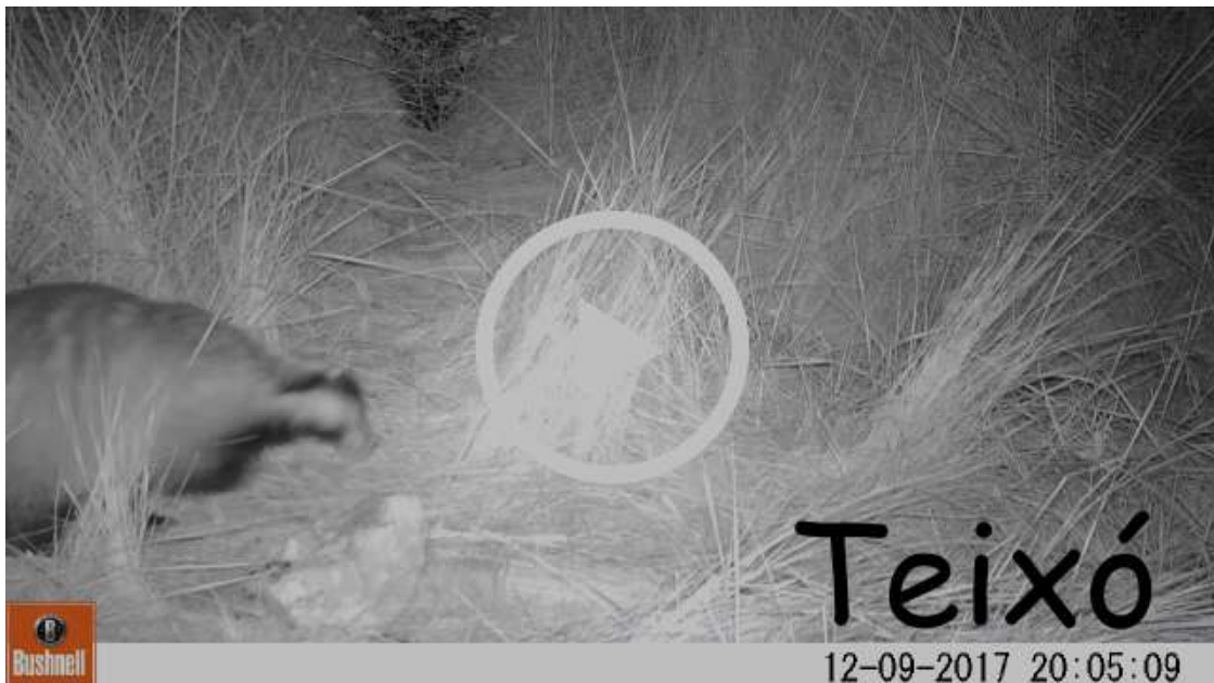
VÍDEO: Els habitants secrets de la Serra Calderona Los habitantes secretos de la Serra Calderona