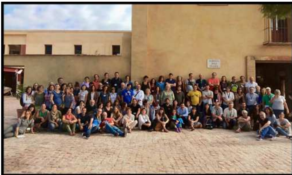
28,29 y 30 septiembre. IV Encuentro Estatal y XIV Seminario Permanente de Equipamientos de Educación Ambiental. Centro Educación Ambiental Comunidad Valenciana. Sagunto (Valencia).