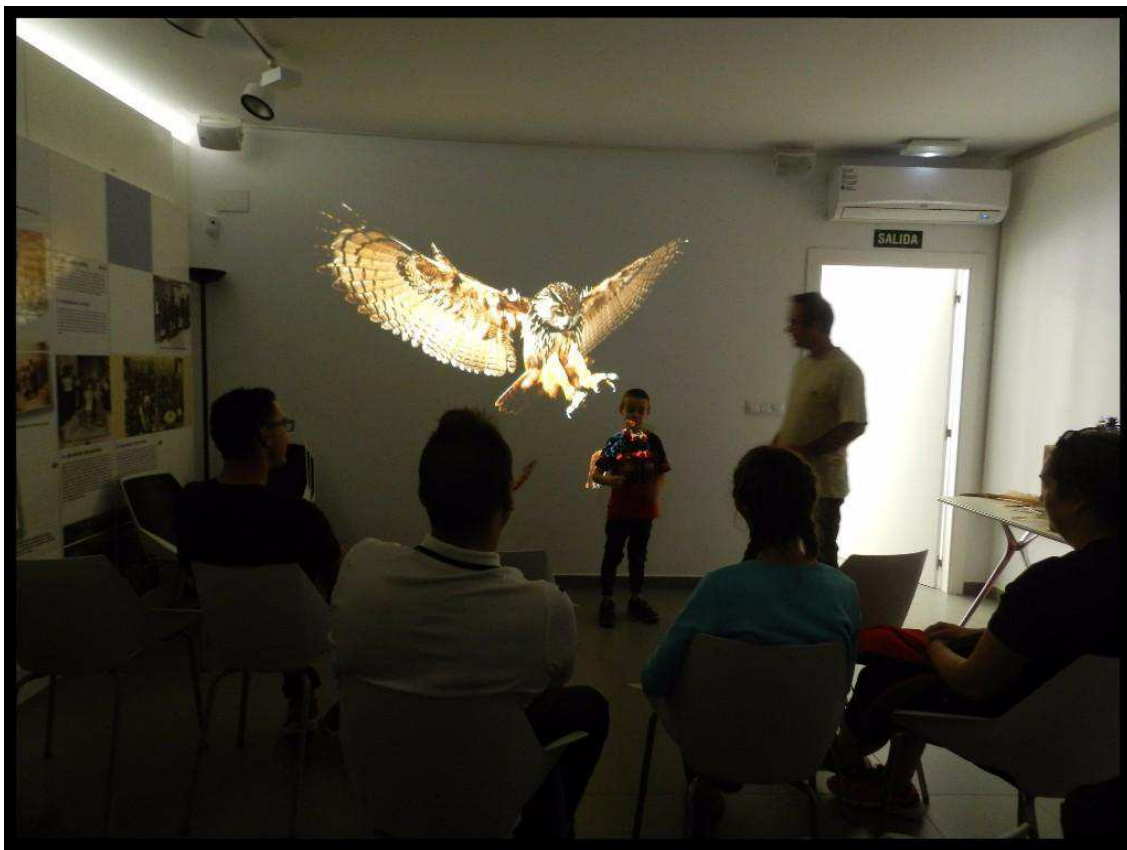
29 d'octubre. Xarrada: Aus del Parc Natural Serra Calderona. Dia internacional de les Aus.