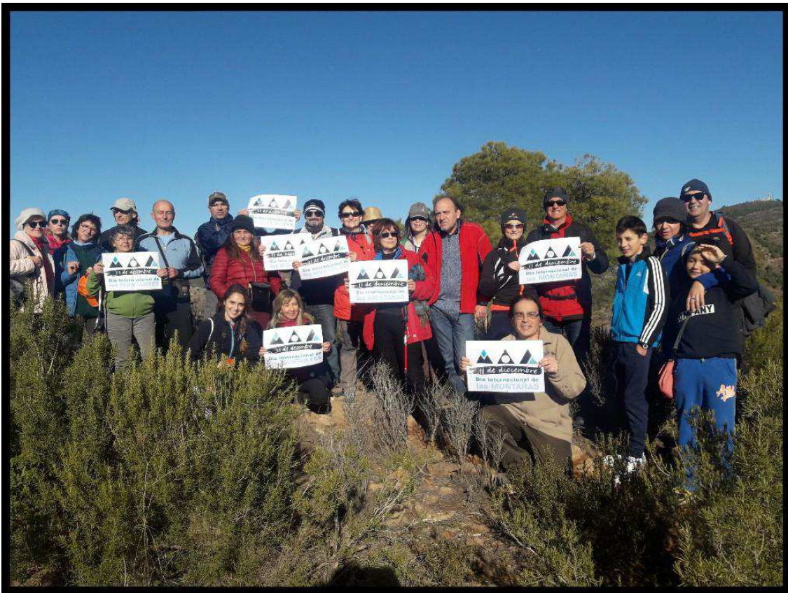
17 Desembre. DIA INTERNACIONAL MUNTANYES. Pujada al Montcúdio, Nàquera. 17 Diciembre. DÍA INTERNACIONAL MONTAÑAS. Subida al Montcúdio, Nàquera.

Per a consultar números anteriors del Butlletí punxa ací Para consultar números anteriores del Boletín pincha aquí