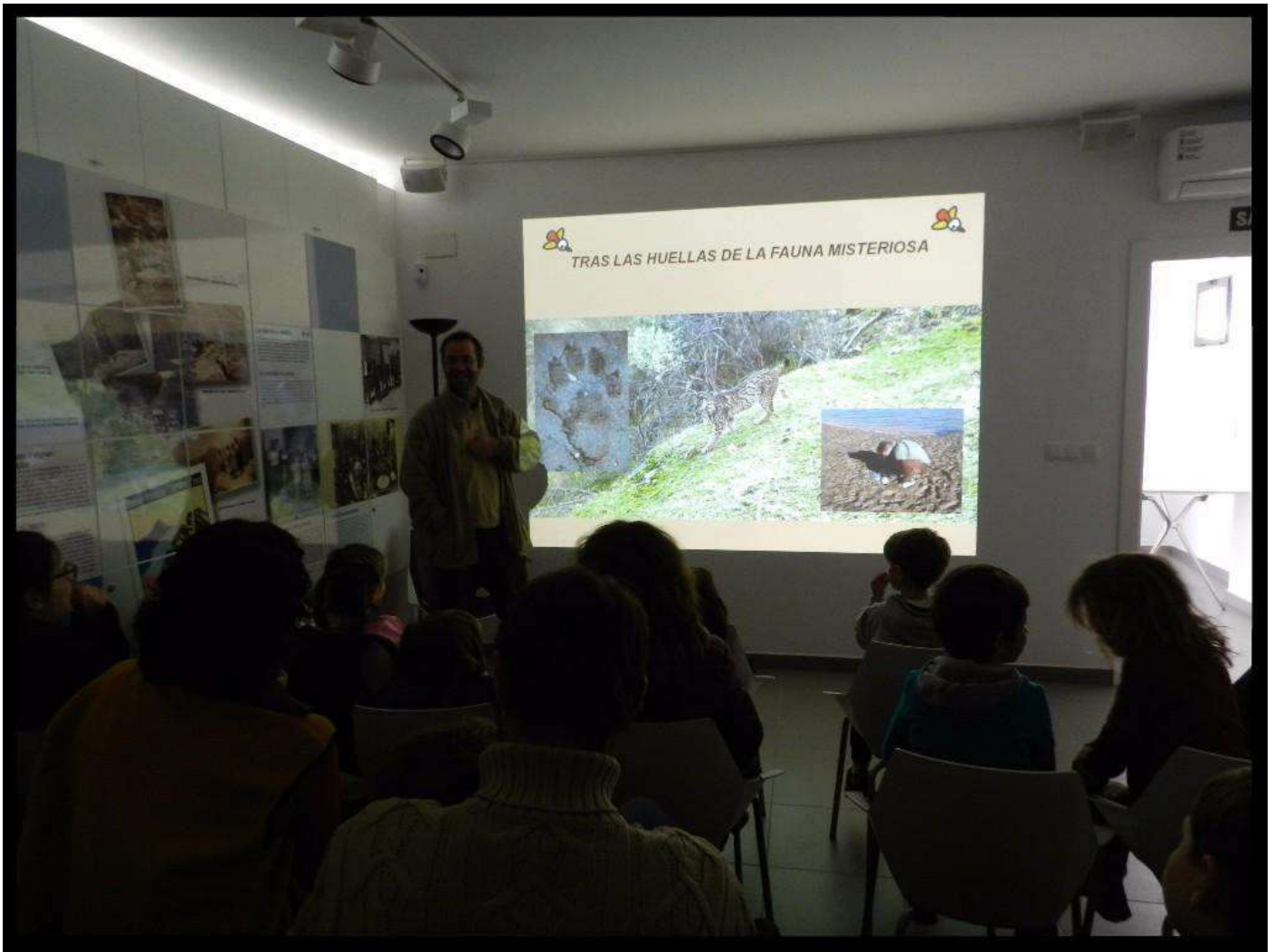
25 de març: Xarrada Darrere de les petjades de la fauna misteriosa. 25 de marzo: Charla Tras las huellas de la fauna misteriosa.