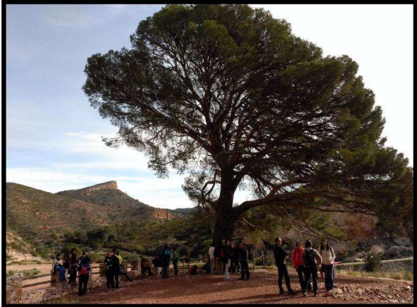
29 de gener. Ruta Botànica al Pi del Salt (Nàquera). Dia de l'Arbre. 29 de enero. Ruta Botànica al Pi del Salt (Náquera). Día del Árbol.