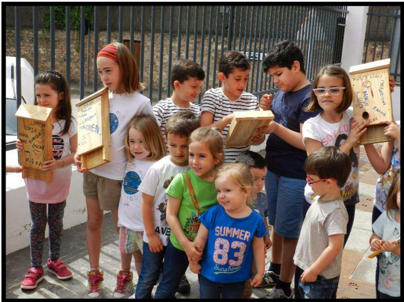
21 de maig: Celebrant el Dia Europeu dels Parcs. Taller de caixes refugi per a rates penades, amb voluntaris de Red Eléctrica de España (REE).