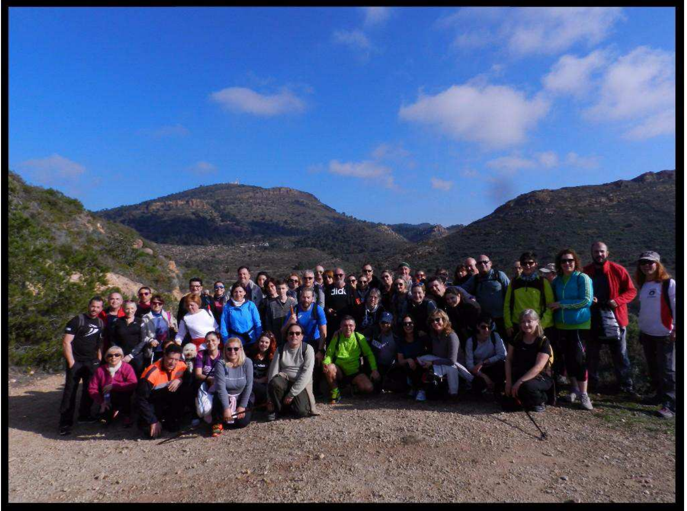
26 de febrer: IV Marxa Solidària contra el Càncer. Caminant pel Montcúdio. 26 de febrero: IV Marcha Solidaria contra el Cáncer. Caminando por el Montcudio.