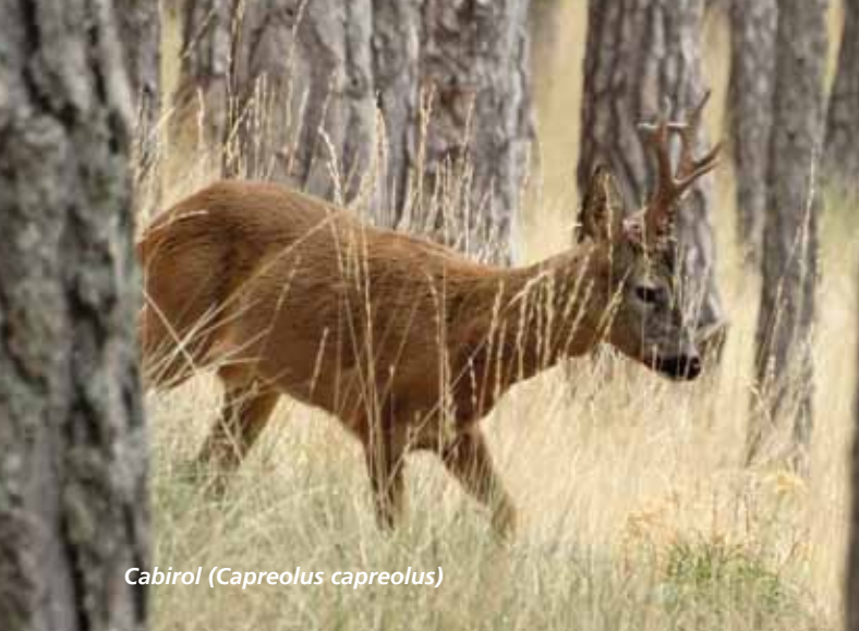
Cabirol (Capreolus capreolus)