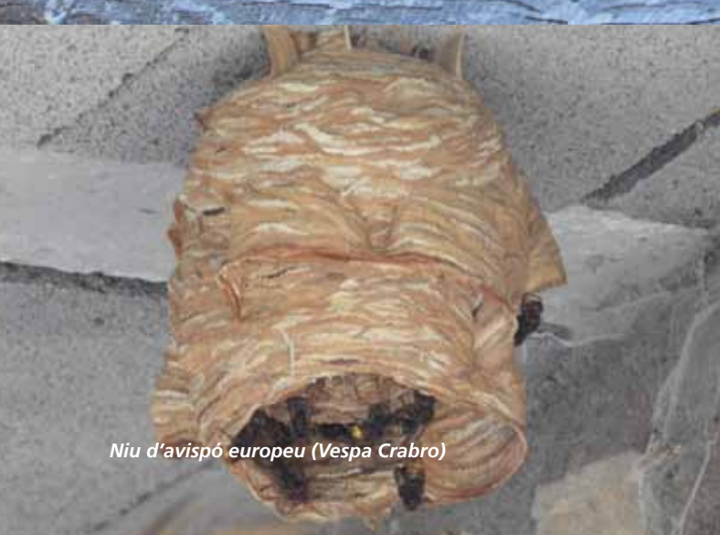
Niu d'avispó europeu ( Vespa Crabro )