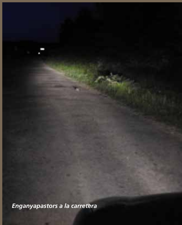
Enganyapastors a la carretera

Quant al seu costum de posar-se al vespre en les carreteres existeixen diferents explicacions: menys obstacles per a l'enlairament i aterratge en un medi obert (el enganyapastors té unes patetes molt curtes), facilitats en la caça