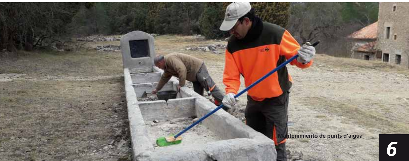
Mantenimiento de puntos d'aigua

També s'ha posat especial interès en aquests mesos més secs a reparar i assegurar els punts d'aigua del parc per a facilitar l'accés a l'aigua per part de la fauna silvestre als abeuradors de St. Joan de Penyagolosa, a la Lloma Bernat i al barranc Obscur.