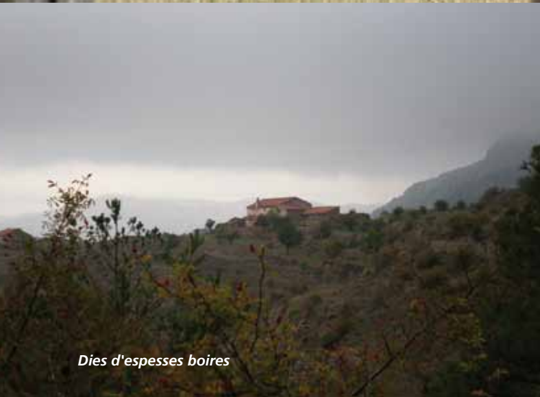
Dies d'espesses boires