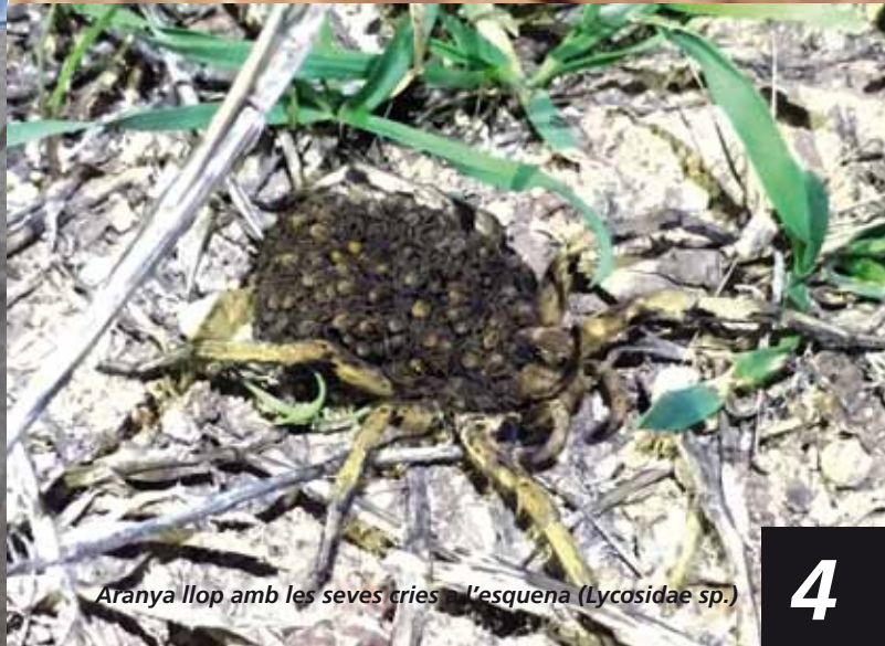
Aranya llop amb les seves cries - l'esquena ( Lycosidae sp. )