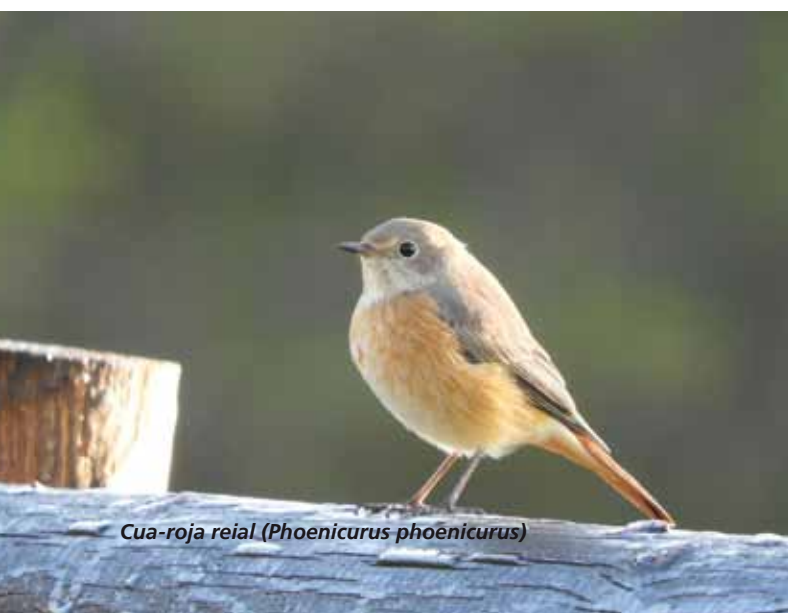
Cua-roja reial ( Phoenicurus phoenicurus )

24 de setembre: També les aranyes són bones mares! Una femella d'aranya llop ( Lycosidae sp. ) observada en el Pla de Vistabella transporta a la seua nombrosa prole sobre el llom protegint-les de possibles predadors.