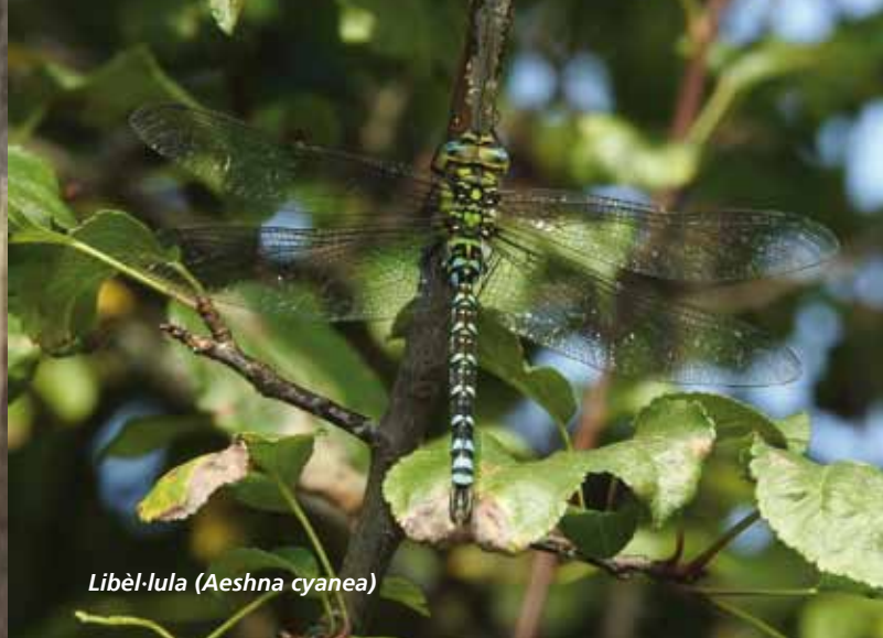
Libèl·lula (Aeshna cyanea)