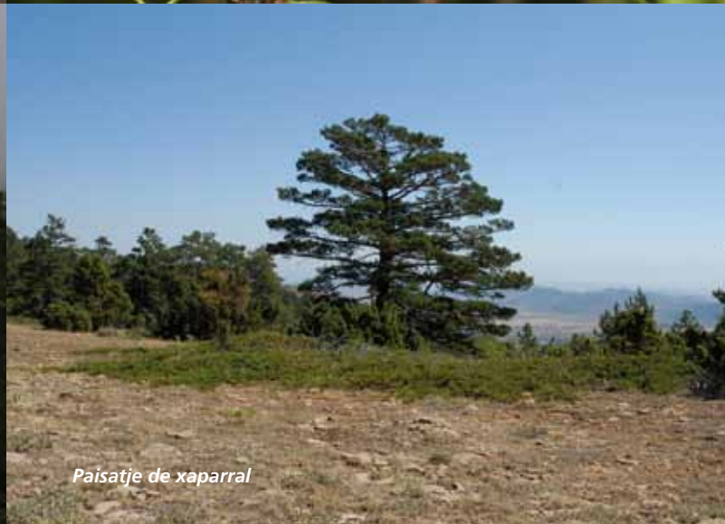
Paísatge de xaparral