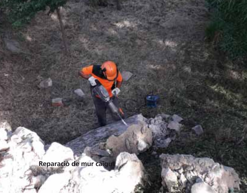
Reparació de mur caigut