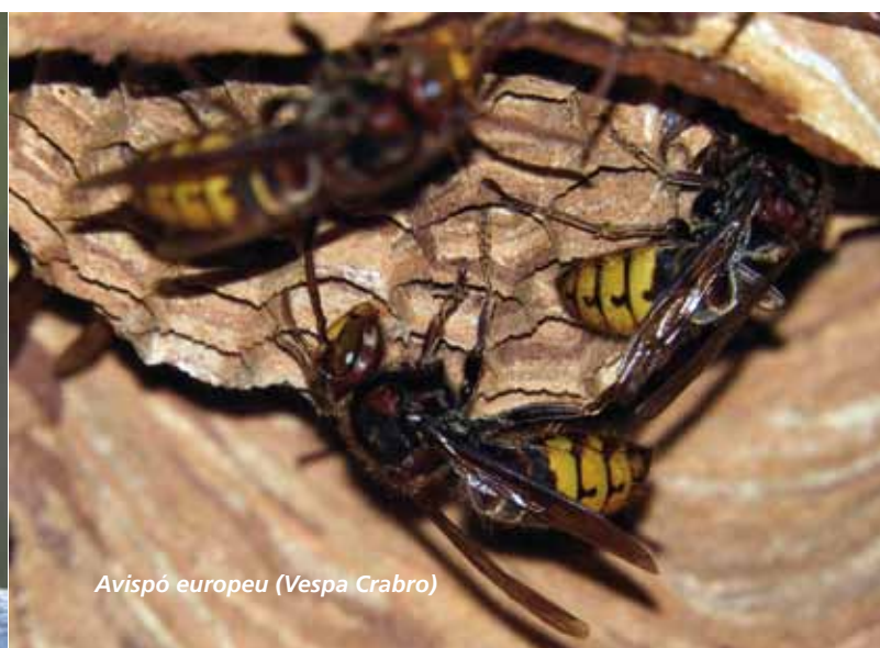
Avispó europeu ( Vespa Crabro )