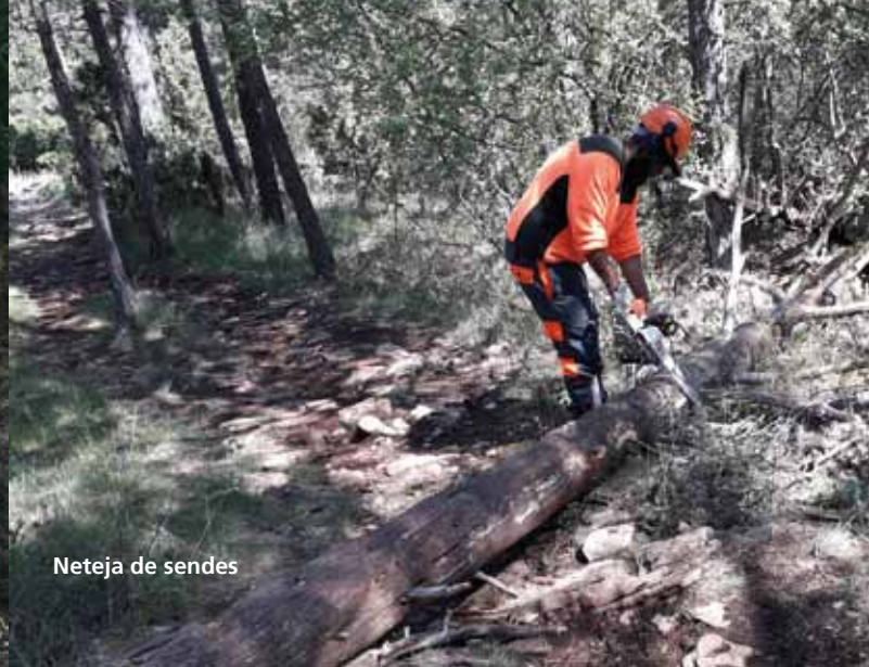
Neteja de sendes