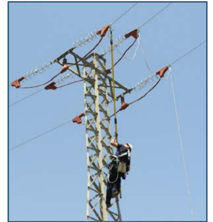
Operari d'Iberdrola instal·lant aïllants en una torre de la marjal.

El Club de Caçadors de Pego va col·laborar en l'obertura de lluents per a la correcció de 4 suports de molt difícil accés per estar en zona inundada amb molta vegetació.