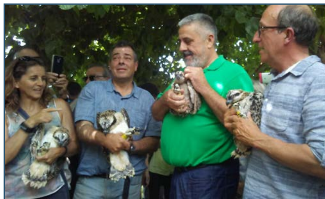
Rebent els 4 polls d'àguila pescadora.

El passat 14 de juny de 2019 es van introduir els primers 4 polls d'àguila pescadora en les instal·lacions de l'Ajuntament de Pego situades al Parc Natural de la marjal de Pego-Oliva. Mitjançant la tècnica de hacking o cria campestre, els polls, situats en dos gàbies grans, són alimentats sense que vegem als seus cuidadors; d'aquesta manera els polls són criats en un niu artificial que simula les condicions naturals, en un entorn al qual podran tornar una vegada aconseguisquen l'edat reproductiva.