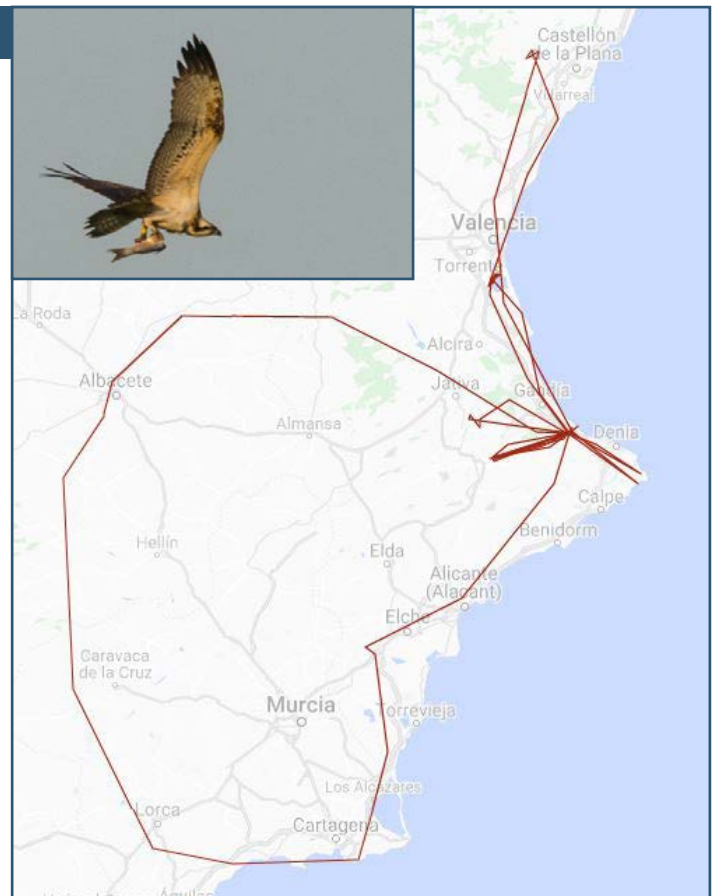
Moviments de Marina.

A la fi d'agost comença a freqüentar l'embassament de Beniarrés, tornant sempre a la marjal de Pego-Oliva. Comença setembre amb un nou recorregut, en aquesta ocasió cap al nord, arribant fins a l'embassament de Sitjar, a Onda (Castelló). Al retorn, arriba al P.N. de l'Albufera on roman des de llavors en els arrossars de Silla, en la riba oest del llac.