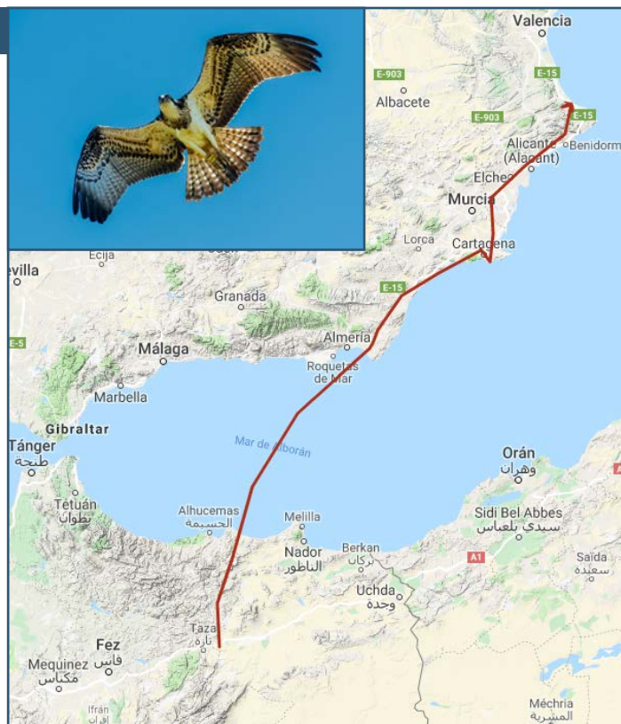
Moviments de Quillo.

El 23 de setembre inicia la seua migració cap a Àfrica. Segueix la costa cap al sud, però a diferència de la ruta de Luigi, Quillo no arriba a Gibraltar, sinó que creua el Mediterrani des d'Almeria, sobrevolant el mar d'Alborán i arribant al Marroc prop d'Alhucemas. Continua volant cap al sud fins a les proximitats de Taza, on perdem la seua pista fins al moment.