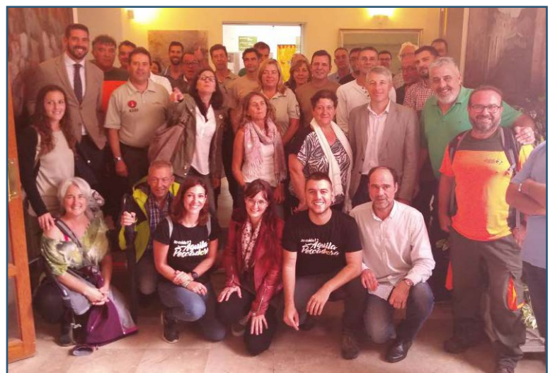
Assistents a l'acte de comiat dels polls d'enguany.

L'acte va comptar amb una bona audiència, amb presència de representants de la Conselleria, Terra Natura, Iberdrola, Confraria de Pescadors de Dénia, Club de Caçadors de Pego, ajuntaments de Pego i Oliva, Parc Natural i de bona part dels voluntaris que han participat desinteressadament en el projecte.