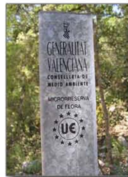
Piqueta perimetral que marca els límits de la microreserva

Senyal informatiu que avisa al visitant de les normes de les microreserves.