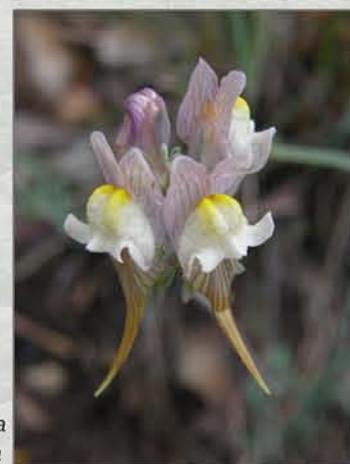
Linaria depauperata subsp. depauperata