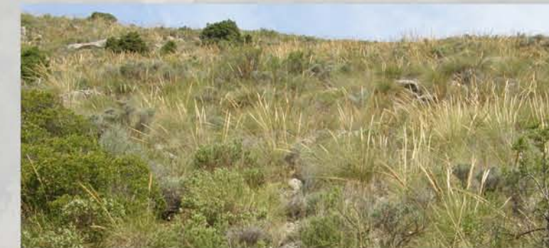
Matollar termomediterrani i preestèpic