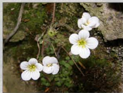
Saxifraga corsica subsp. cossoniana