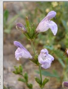
Salvia blancoana subsp. mariolensis