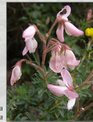
Ononis fruticosa subsp. microphylla