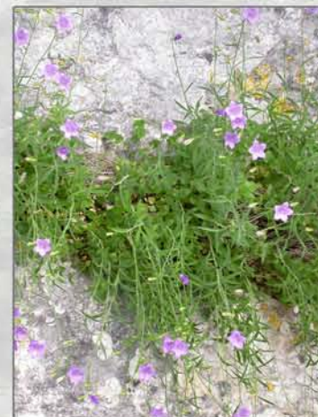
Campanula rotundifolia subsp. aitanica

Espècies prioritàries: Campanula rotundifolia subsp. aitanica , Linaria depauperata subsp. depauperata i Sorbus aria .