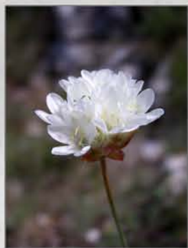
Armeria alliacea subsp. alliacea