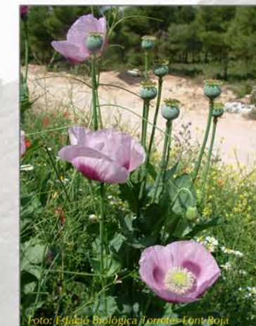
Papaver somniferum subsp. setigerum

Espècies prioritàries: Crataegus granatensis , Linaria repens subsp. blanca , Papaver somniferum subsp. setigerum .