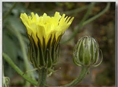
Crepis albida subsp. scorzoneroides

Espècies prioritàries: Armeria alliacea subsp. alliacea , Centaurea mariolensis , Cirsium valentinum , Crepis albida subsp. scorzoneroides , Iberis carnososa subsp. hegelmaieri , Leucanthemum gracilicaule , Salvia blancoana subsp. mariolensis i Saxifraga corsica subsp. cossoniana .