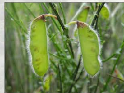
Cytisus scoparius subsp. reverchonii

Espècies prioritàries: Centaurea mariolensis , Cytisus scoparius subsp. reverchonii , Iberis carnososa subsp. hegelmaieri , Leucanthemum gracilicaule , Linaria depauperata subsp. depauperata , Ononis fruticosa subsp. microphylla .