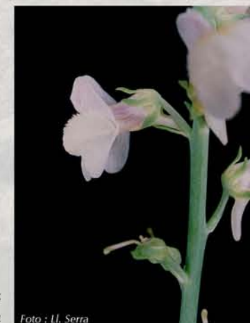
Linaria repens subsp. blanca