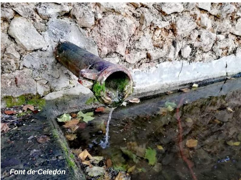
Font de Celedón