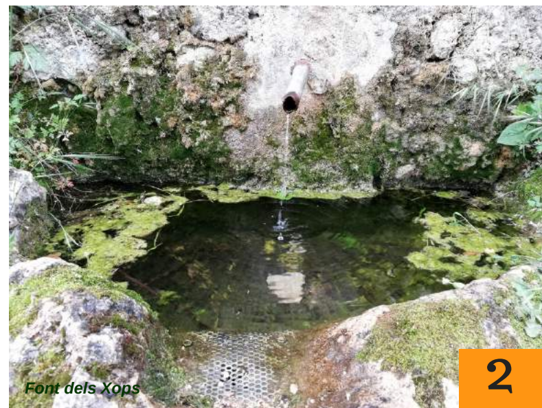
Font dels Xops