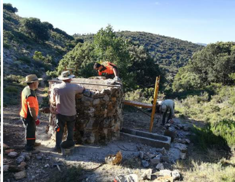
Els membres de la Brigada treballen intensament en l'obra. Aspecte actual del pou després de la seua restauració.

Amb aquesta actuació de manteniment s'han complert diversos objectius com són: la recuperació i revalorització d'un immoble del patrimoni cultural, garantir la seguretat del visitant que pugui veure el pou, i la recuperació d'un punt d'aigua per a la fauna silvestre.