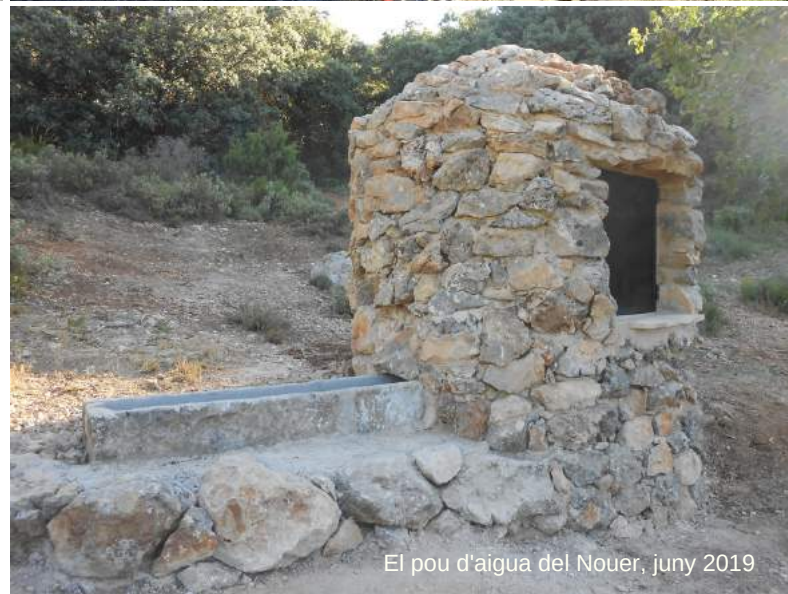
El pou d'aigua del Nouer, juny 2019

Aquest pou d'aigua es pot veure si transites per la senda senyalitzada amb els PRs CV 81 i 26, i es troba ubicat al vessant sud del cim del Menejador, a l'inici del barranc de la Fabriqueta (en terme municipal d'Ibi).