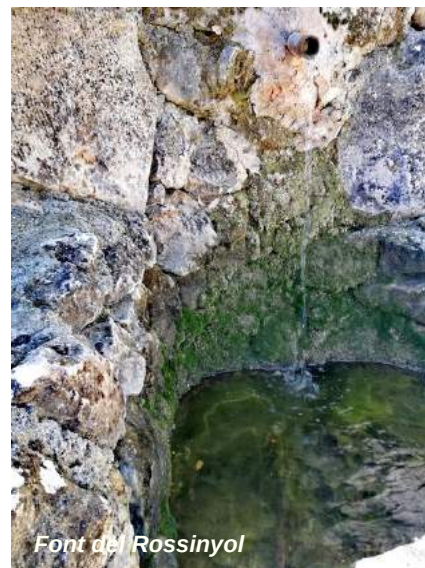
Font de Rossinyol