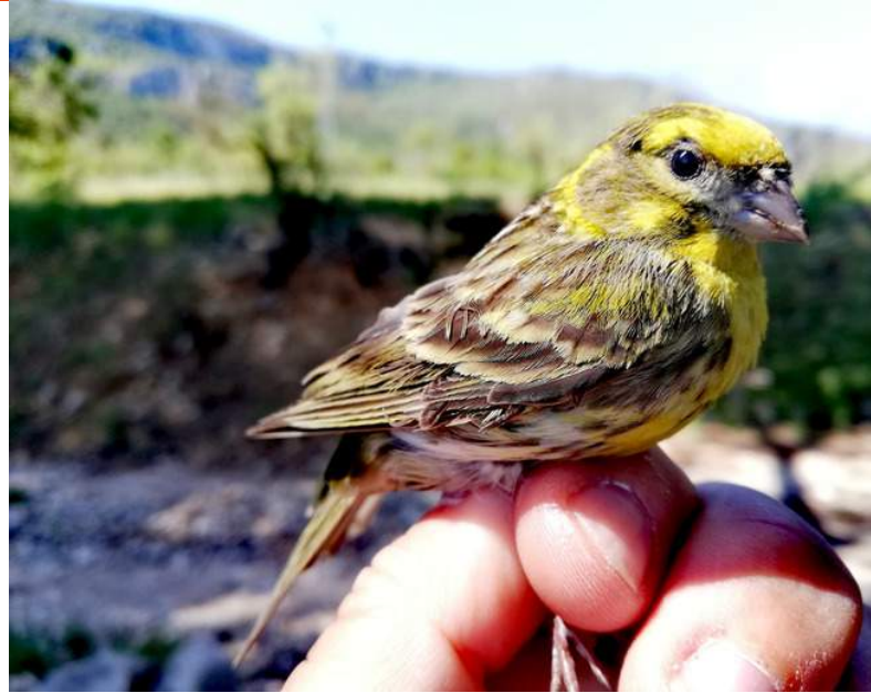
Exemplar mascle de gafarró ( Serinus serinus ) capturat per al seu anellament científic.

L'objectiu fonamental del programa PASER és obtenir, mitjançant dades d'anellament, informació sobre les tendències poblacionals de les aus nidificants en el nostre país.