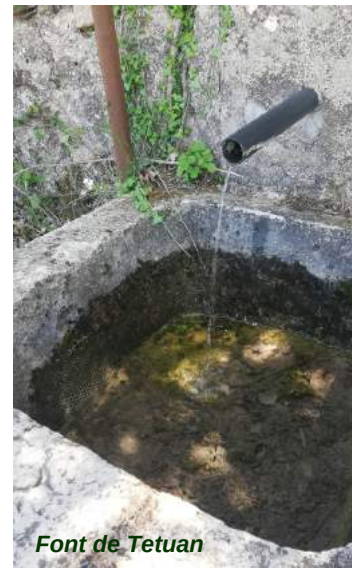
Font de Tetuan