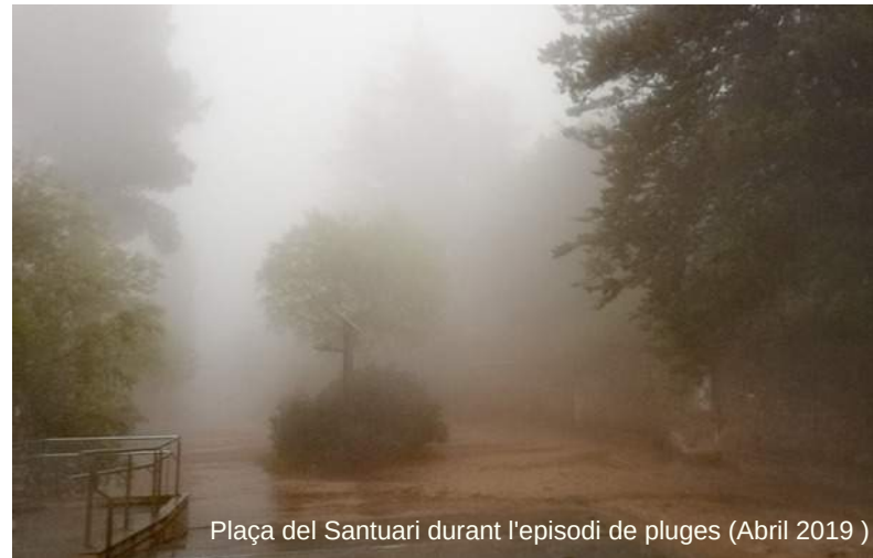
Plaça del Santuari durant l'episodi de pluges (Abril 2019)

Fonts com la del mas de Tetuan, la del Mas de Celedón, la Font dels Xops o la Font del Rossinyol han brollat com feia ja molts mesos que no ho feien. Fins i tot la Font Roja duu mesos amb un cabal d'aigua excedent que supera el que pot retindre el mateix alçavó de la font. Benvinguda siga aquesta pluja primaveral per poder suportar la sequedat de l'estiu.